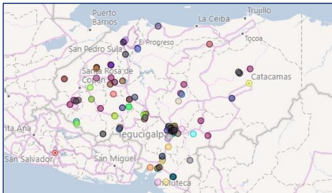
Ilustración 1. Mapa de la ubicación de los CEB del estudio

Con esta información analizada el OBSAN pretende contribuir a fortalecer estrategias, que se ejecutan a nivel de país, para el mejoramiento de la situación de la población escolar, dentro de las políticas públicas relacionadas a la SAN.